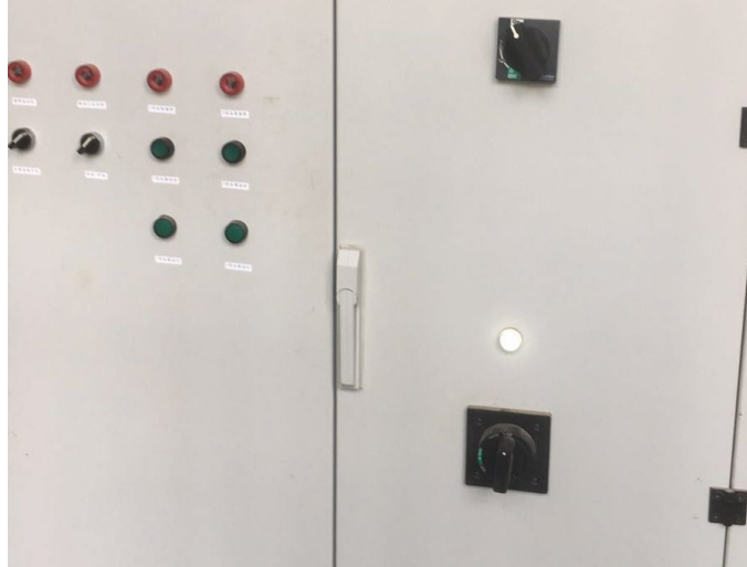
图 1 A 机组电源（上） B 机组电源（下）