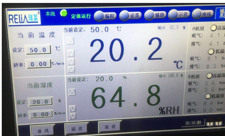
图 6 手动运行界面

(3) 在运行界面依次输入设定的温度、湿度及斜率，逐项开启通风、温度、湿度；关机时反之（详细内容可浏览触摸屏使用说明书第三章，图 11）。