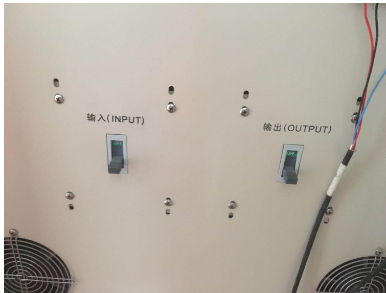
图 10 光照变电器柜门的输入和输出电源