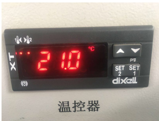
图 3 温度保护控制器

(3) 温度保护软件设置：在触摸屏设置界面设置温度上下限，温度保护触摸屏界面如图 3 所示。