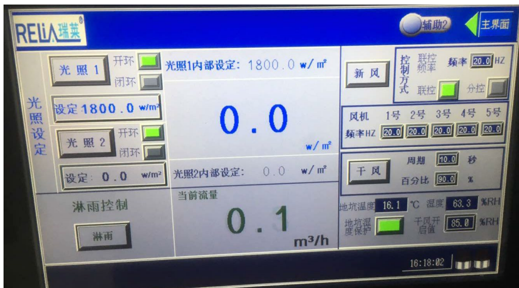
图 8 触摸屏辅助界面