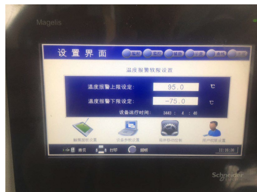
图 4 温度保护触摸屏界面