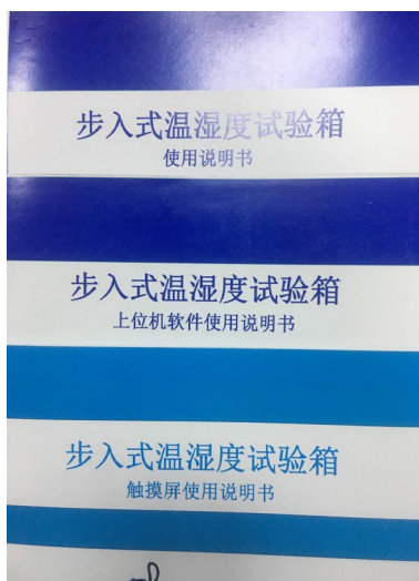
图 5 随设备携带的说明书