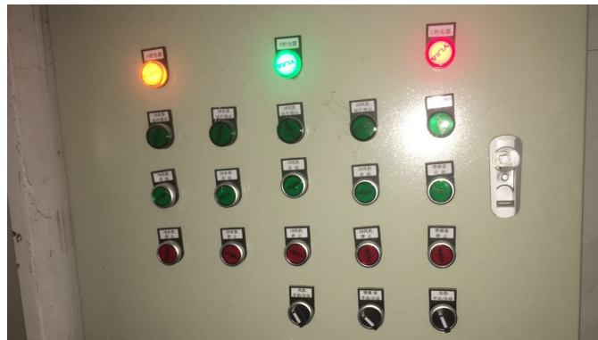
图 2 冷却水塔操作控制柜