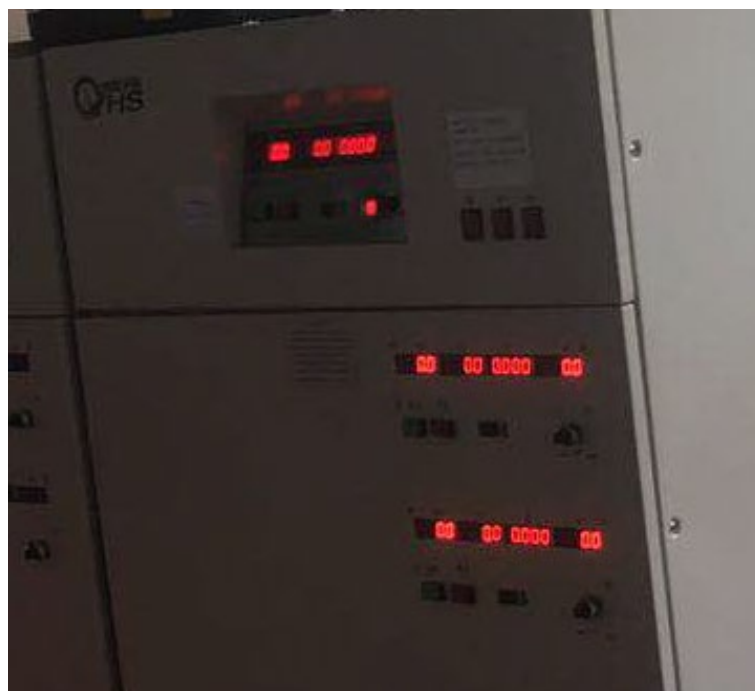
图 4 光照变电器的三个绿色启动按钮