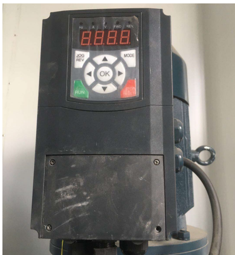
图 9 淋雨变频器