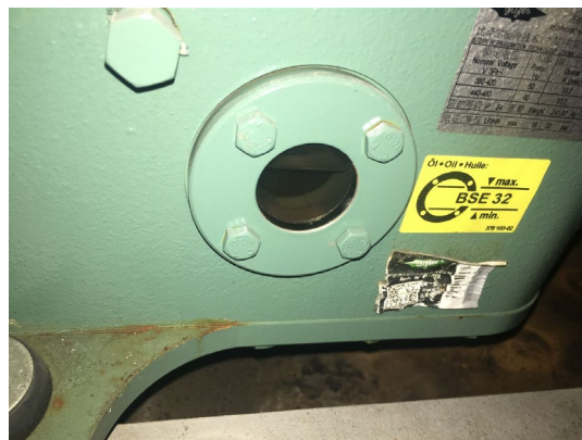
图 7 压缩机油镜