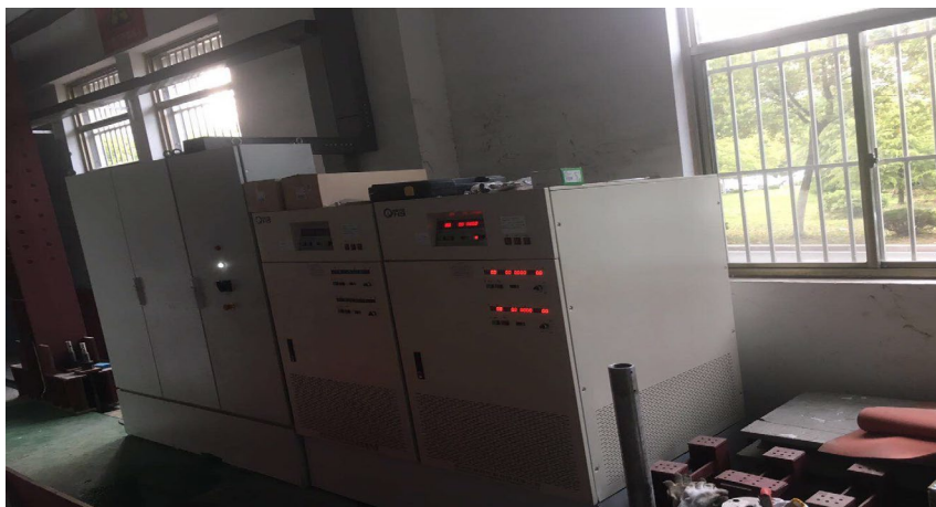
图 7 强风、淋雨、光照电源柜（左）

(2) 在触摸屏辅助界面（如图 8）设置强风电机频率，并启动新风按钮；调整频率至风速符合要求后，放入样品开始试验。分控可逐一操作强风电机的频率，联控可统一操作强风电机频率。同时要注意：强风电机可执行的频率范围。